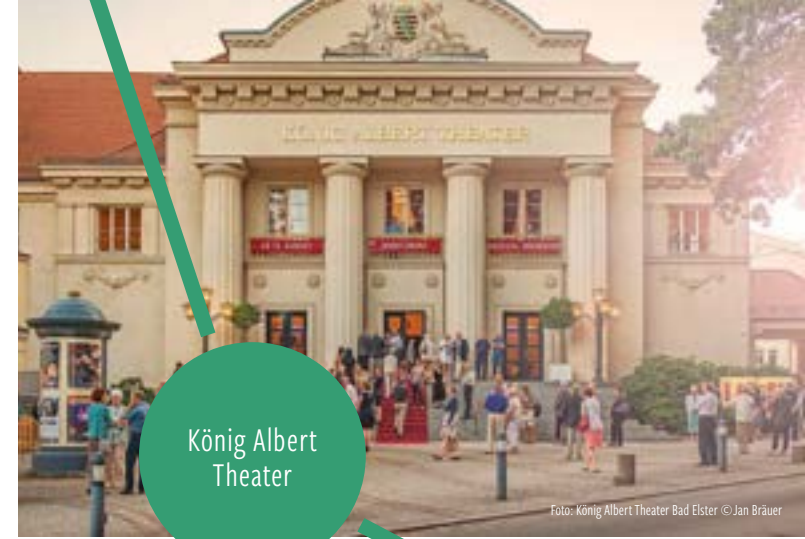
König Albert Theater