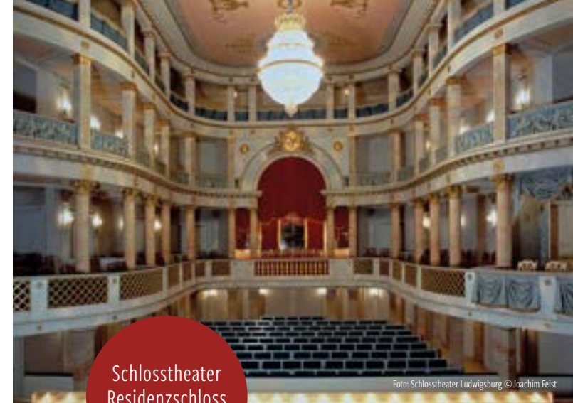
Schlosstheater Residenzschloss Ludwigsburg